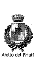
Aiello del Friuli