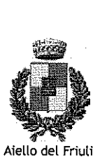
Aiello del Friuli