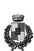
Aiello del Friuli